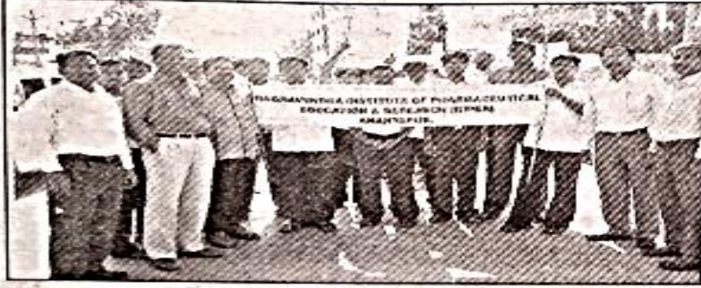
ర్యాలీ నిర్వహిస్తున్న ఫార్మసీ విద్యార్థులు

జేఎన్టీయూ. న్యూస్ టుడే: రామవేంద్ర ఫార్మసీ కళాశాల విద్యార్థులు సోమ వారం నగరంలో ర్యాలీ నిర్వహించారు. సప్తగిరి సర్కిల్ నుంచి టవర్ క్లాక్ వరకు సాగింది. పొగాకు నివారణకు ప్రతి ఒక్కరూ కృషి చేయాలన్నారు. పొగాకు వీల్చడం వల్ల