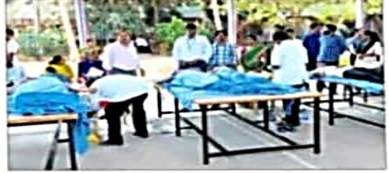
రక్తదానం చేస్తున్న విద్యార్థులు