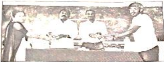
పుస్తకాలు పంపిణీ చేస్తున్న ఆర్థిక ఇన్సాయిల్

క్రీస్తుమరణివల్ల మృత్యు ఊయే నిర్మలమల కలంను విల్లల సాకారు చేసినపుడే సార్వకాలి మిలువన ఆర్థిక ఎకే నిర్మలమల వేల్పా స్వారు ఖైదారు కామ నిల్ల వాసిన కళాశాలలో విద్యార్థులకు గురుని సువే కినిచ్చారు. ఈ సంద బ్ధంగా ఆయన మాట్లా మతూ విద్యార్థి ఒక లక్ష్యాన్ని నిర్వేకించుకువి చదవాలి సప్టెంట్ చదివితే ఆసాధ్య కును ముసాధ్యుల చేయవ న్నది ఆభిప్రాయవద్దారు. క్రిందింబ్రులు ఆకలకు